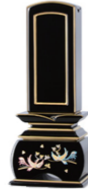
回出鳳凰おしどり塗