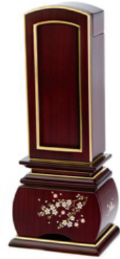
回出風桜黒壇・紫壇