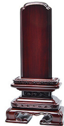
千倉角丸 黒檀・紫檀