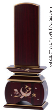
「なほしつ」のひびき