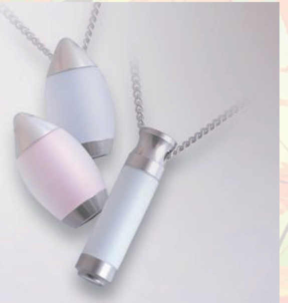
グリーンフペンダント