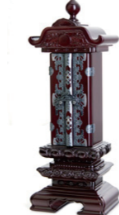
雲二重回出 黒檀・紫檀