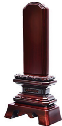
角切葵 黒檀・紫檀