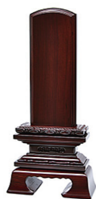
連付春日 黒檀・紫檀