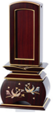
回出鳳凰おしどり黒壇・紫壇