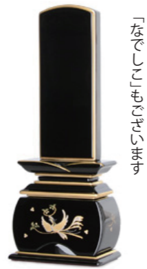
「なほしつ」のひびきを

桜模様の蒔絵(絵や文様、文字を描き、乾かないうちに金粉を「蒔く」ことで器面に定着させる技法)が紫壇の中で映え、華やかな印象を与えます。また、金箔・金粉はこだわりの金沢産を100%使用しました。金沢の金箔は上質で美しい光沢を持つ、高級金箔です。