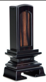
回出春日 黒檀・紫檀