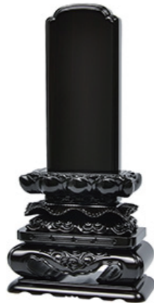
上等猫丸 黒檀・紫檀