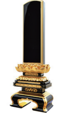
極上千倉吹蓮華 本呂色