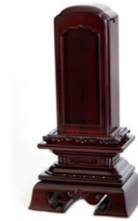
回出勝美 黒檀・紫檀